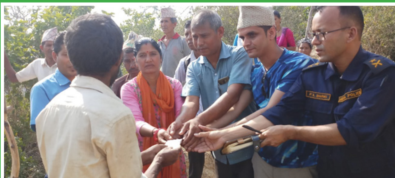
Peace volunteers on peace initiatives and community peace center Providing financial support to fire victim at Goltakuri in the presence of rural municipality stakeholders, SWC member and Police chief during monitoring visit from the SWC Kathmandu.