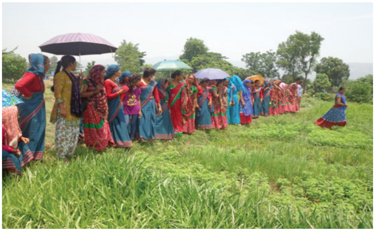
Members in fodder production training conducted in Lamahi municipality-1, Sonpur