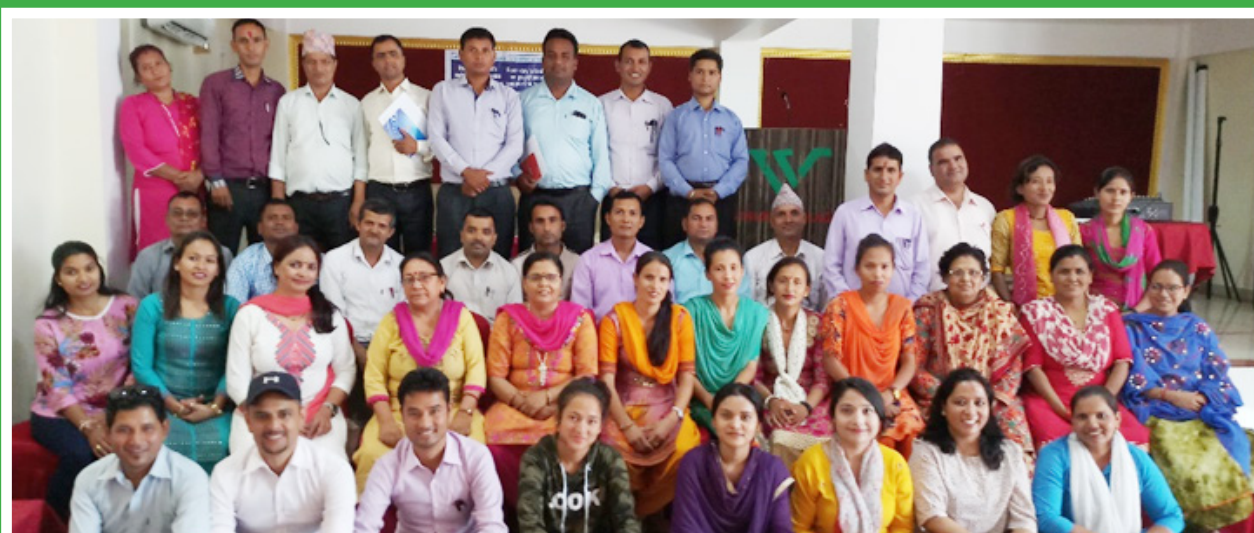
Participants of Psychosocial support Training