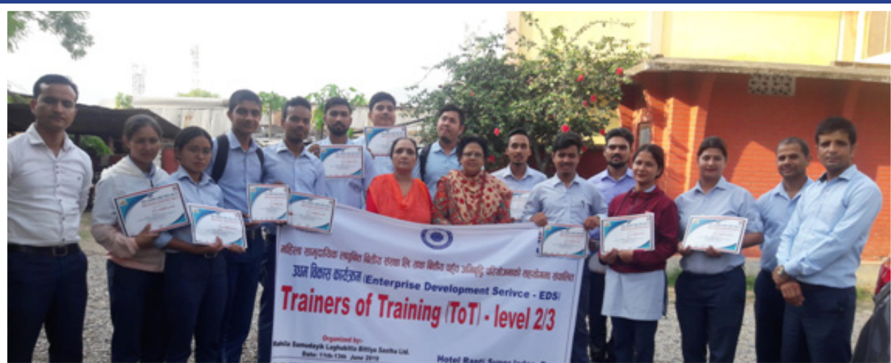
Enterprise development officers(EDOs) in group after Trainers of Training(ToT) conducted in Ghorahi, Dang