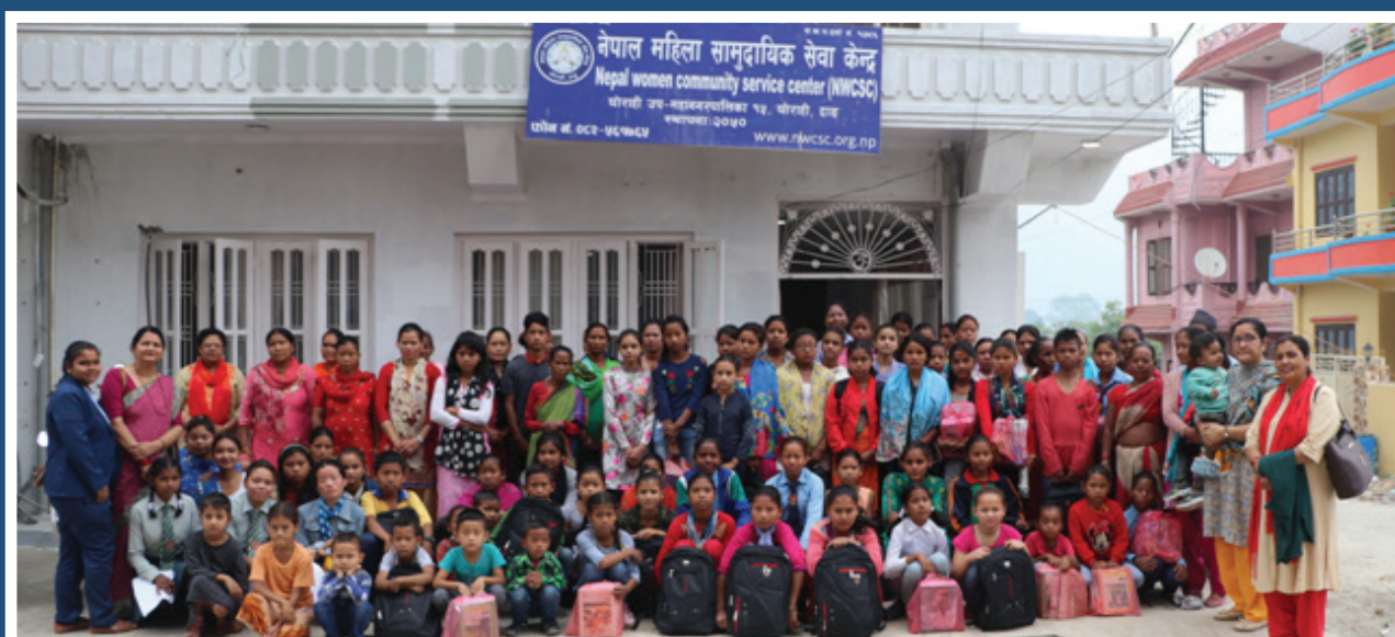
Education material distribution to children in FY 2018/2019