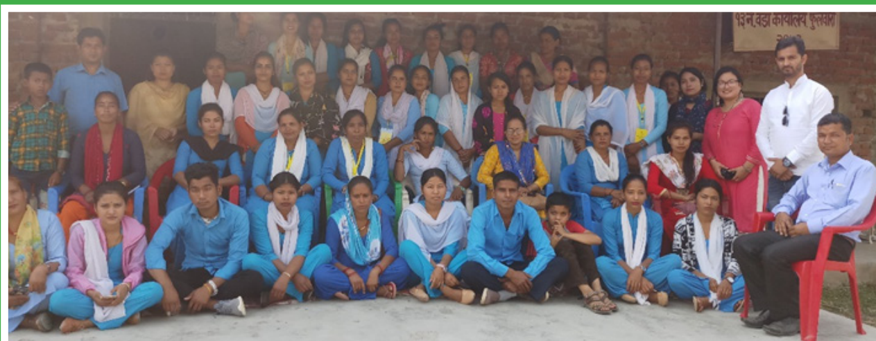
Peace volunteer awareness on Gender issue at Tulsipur 13 Phulbari