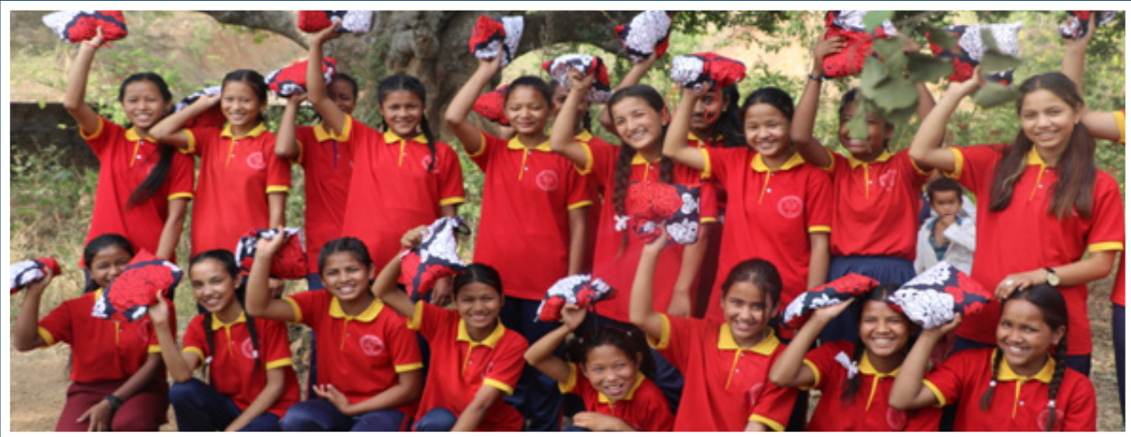
Girls receiving sanitary pad