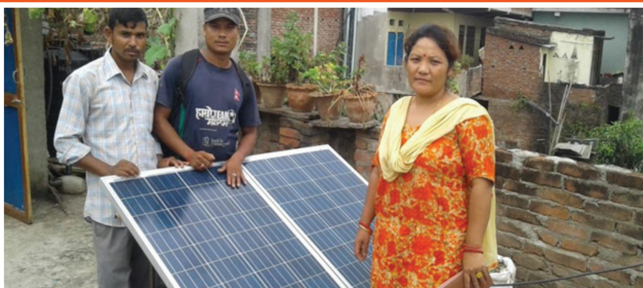
Happy client with 200 watt solar home system