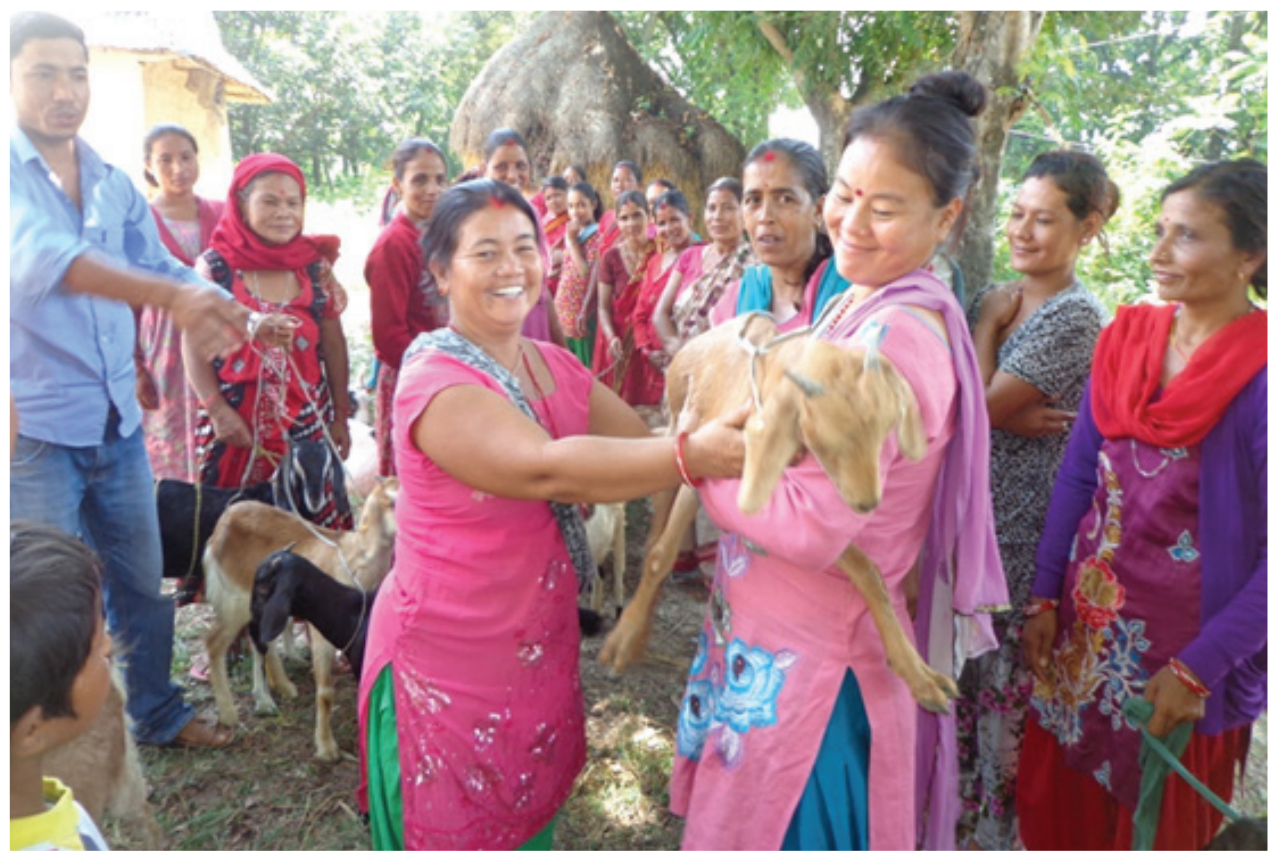
Members in Passing on Goat as Gift to other member